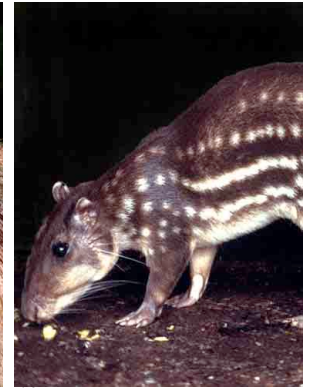
10 Conejo pintado Paca Agouti paca