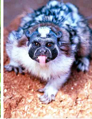
4 Mono Titi Geoffroy's Tamarin Saguinus geoffroyi