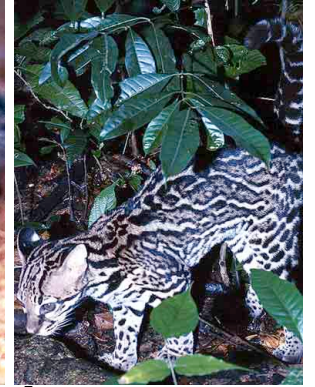
5 Ocelot Manigordo Leopardus pardalis