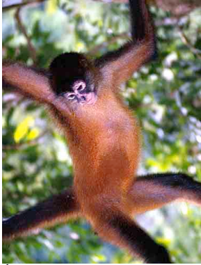
1 Mono Colorado o Araña C. Am. Spider Monkey Ateles geoffroyi Foto: R. Foster

© Environmental & Conservation Programs, The Field Museum, Chicago, IL 60605 USA. web: [http://www.fmnh.org/animalguides/], e-mail: [RRC@fmnh.org] Rapid Color Guide # 27 version 2