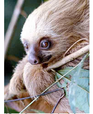
15 Perezoso de dos dedos Hoffmann's 2-toed Sloth Choloepus hoffmanni