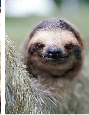
14 Perezoso de tres dedos Brown-throated three-toed Sloth Bradypus variegatus