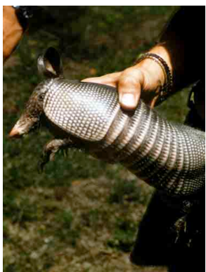
16 Armadillo Nine-banded long-nosed Armadillo Dasypus novemcinctus