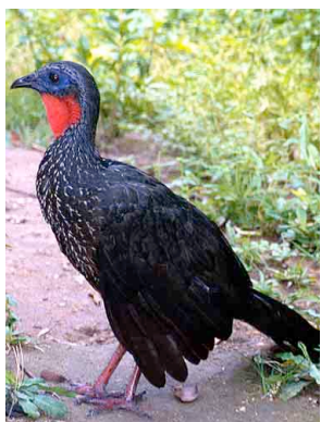
17 Pava gazuacha Crested Guan Penelope purpurascens