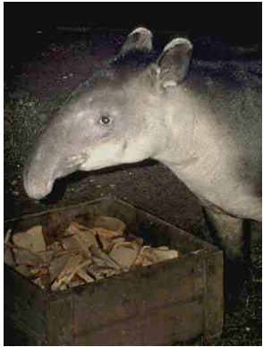
6 Macho de monte Baird's Tapir Tapirus bairdii