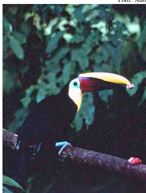
18 Toucan Chestnut-mandibled Toucan Ramphastos swainsonii