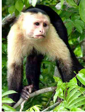
3 Mono Cariblanco White-throated Capuchin Monkey Cebus capucinus