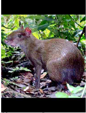
11 Ñeque C. Am. Agouti Dasyprocta punctata