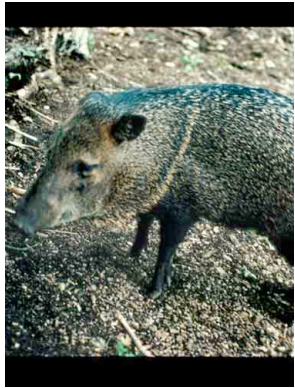
7 Samo Collared Peccary Tayassu tajacu