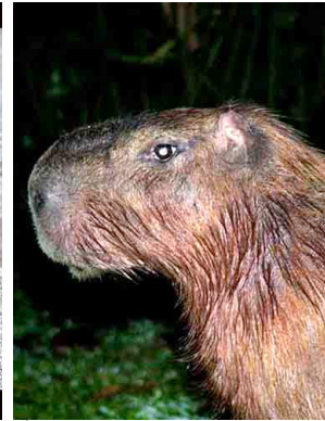
9 Capibara Capybara Hydrochaeris hydrochaeris