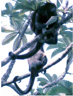
2 Mono Negro o Aullador Mantled Howler Monkey Alouatta palliata