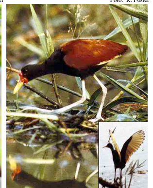
20 Jacana Wattled Jacana Jacana jacana