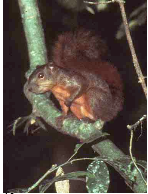
12 Ardilla roja Red-tailed Squirrel Sciurus granatensis