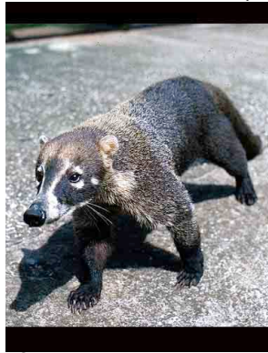
8 Gato Solo White-nosed Coati Nasua narica